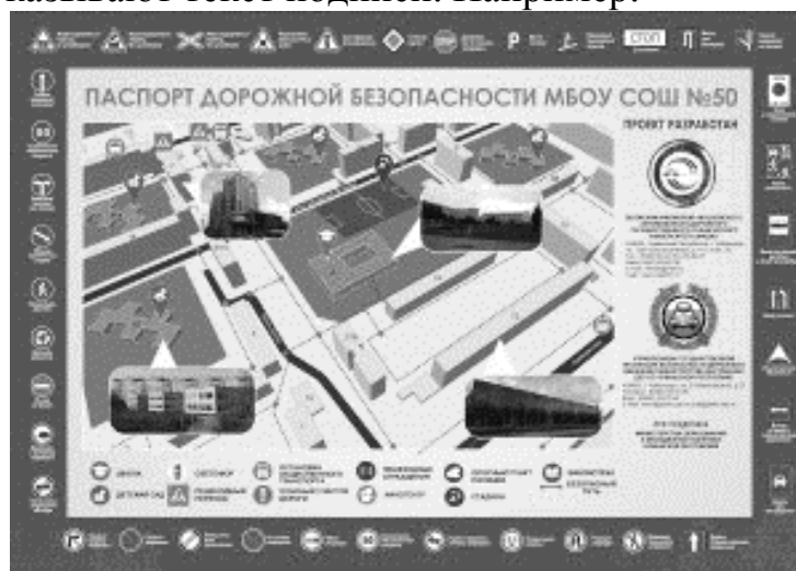
Рисунок 1. Подпись рисунка

10. Рисунки могут располагаться в тексте непосредственно после того абзаца, в котором данный рисунок был впервые упомянут. Между этим абзацем и рисунком оставляют одну пустую строку. Положение рисунка центрируют. Рисунок должен иметь название. Подписи к рисункам печатаются сразу под ними и начинаются со слова «Рисунок», далее следует номер рисунка. После номера рисунка ставят точку, затем с большой буквы указывают текст подписи. Например: